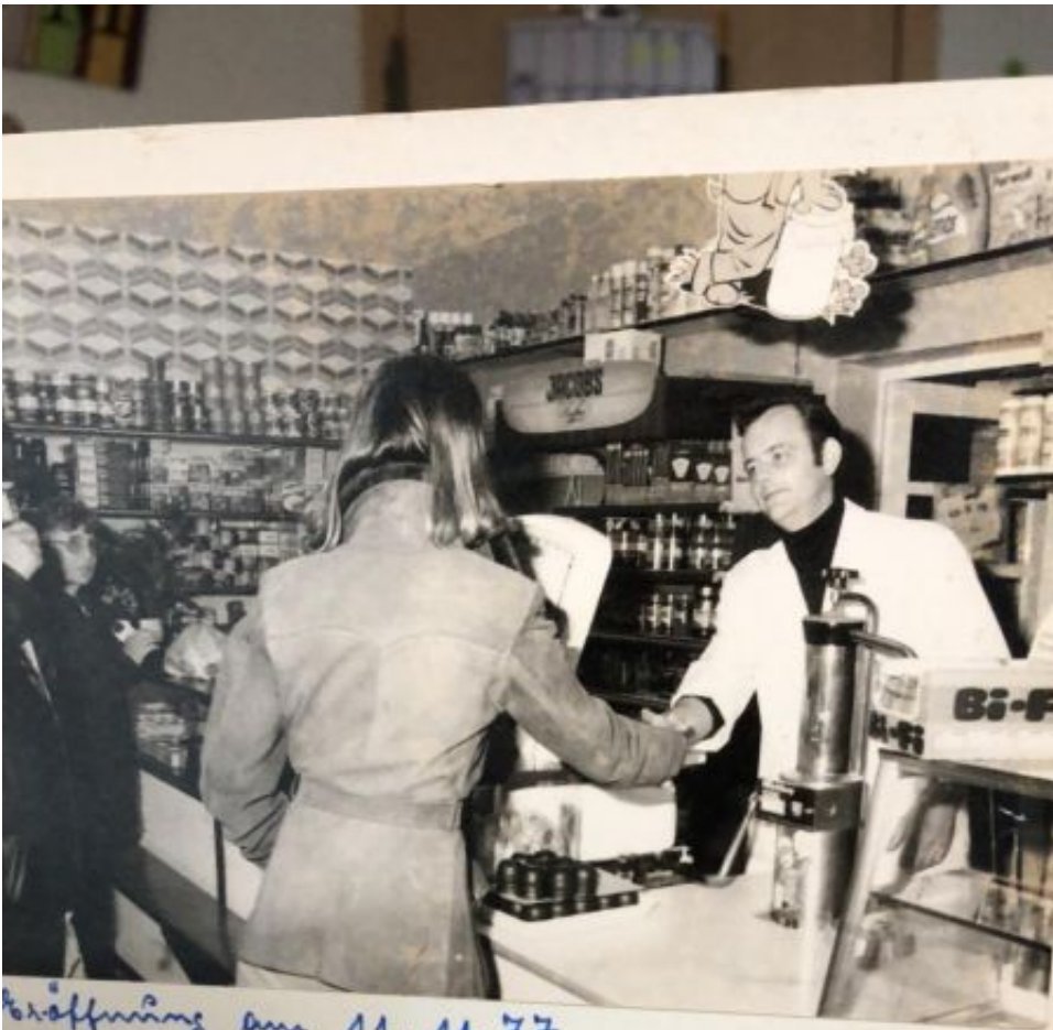
Eröffnung am 11. 11. 77