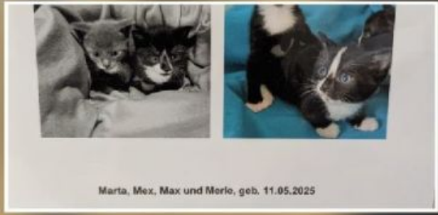
Marta, Mex, Max und Morio, geb. 11.05.2025

Dobby, geb. ca. 2017 mit einer sehr schweren Verletzung am Rücken hatten wir vor einigen Jahren den sehr schönen Dobby aufgefunden, sofort tierärztlich behandeln und ihn im Anschluss in einer unserer Pflegestellen wieder aufzupäppeln lassen. Es hat lange gedauert, bis die Wunde wieder richtig verheilt und Dobby machte es seiner Pflegemama nicht einfach. Ständig musste die Wunde gewaschen und gespült werden, aber mit der Zeit wurde er vertrauter und ließ die Behandlungen zu. Dann traten zusätzlich kleine Knötchen an seinem Zahnfleisch auf. Bei Dobby wurde eine Autoimmunerkrankung (Gonubien) festgestellt, die nicht heilbar aber so vergingen Monate und Jahre mit regelmäßigen Arztbesuchen, aber niemand auch für immer dort bleiben wird. Dobby hat sich zu einem sehr vertraulichen und sehr anhänglichen Kater entwickelt, vielleicht mag jemand mit einem kleinen Monatsbeitrag für Dobby eine Patenschaft übernehmen? Dann gerne melden.